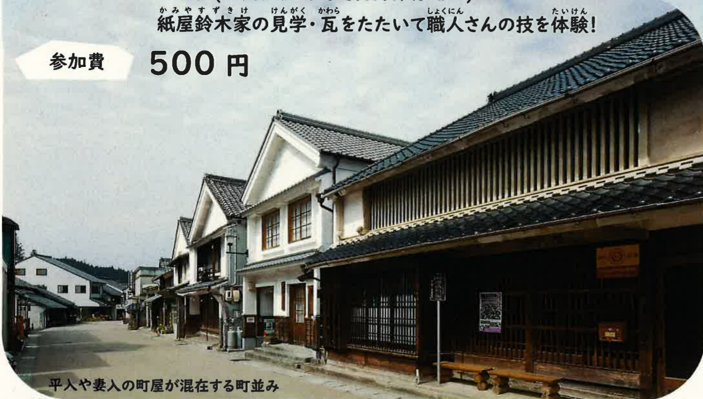
平人や妻入の町屋が混在する町並み