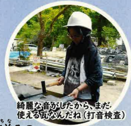
綺麗な音がしたから、まだ使える瓦なんだね(打音検査)