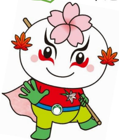
小原地区マスコットキャラクター おぼらっきー

7月1日(土)～7月20日(木)まで “小原歌舞伎ロビー展”を開催 7月17日(月)～7月21日(金)まで “小原和紙のふるさとワークショップ”と 和紙工芸作品の展示を開催