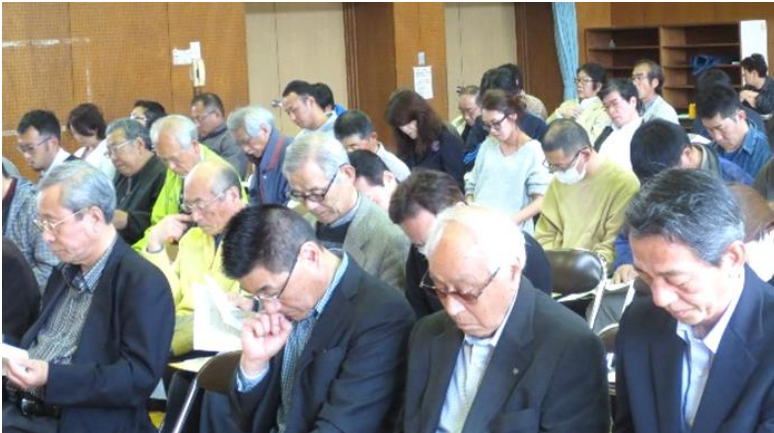
事前協議会の様子

4 月 15 日(土)には「第 1 回総務会」を開催し、役員選出、事業計画と予算を決議しました。