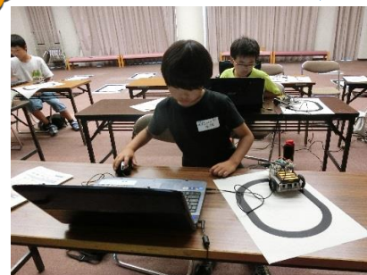
まずは、黒い線の上を走れるようにプログラミング。