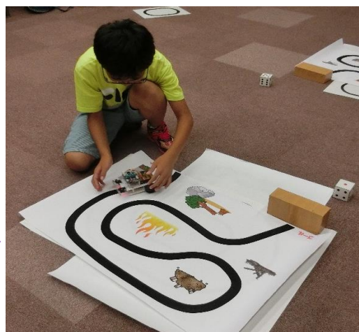
今日の集大成「ロボットレスキュー」複雑なコースを進み、がれきに当たったらサイレンを鳴らし、救助を要請! 最後は、けが人を救出してスタート地点に戻ってきます。完走できるか!?

最初は皆、緊張気味でしたが、パソコン操作が不慣れな子も、手順に沿って進めることで、楽しくプログラミング体験ができました。与えられた課題がクリアできた子は、ロボットにオリジナルの動きをさせることができるように、自分でプログラムを考え、独創性を発揮していました。友達同士でロボットの動きを競い、困った時は、相談し、助け合う姿も見られ、達成感と満足感を味わうことができました。