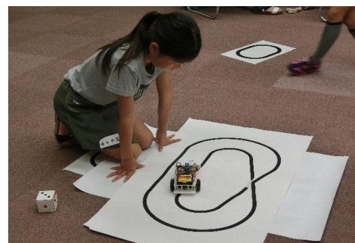
コースがどんどん、複雑に。上手く迎れるように、何度もプログラムを修正してトライ!