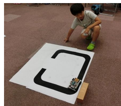
サイコロを振り、指定のポジションからロボットを発進! 黒い線を踏まずに、うまく枠から脱出できるか!?