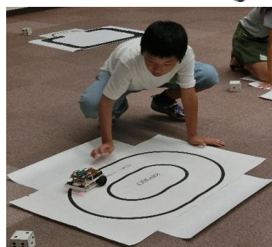
次は、黒い線の上を踏まないようにプログラミング。