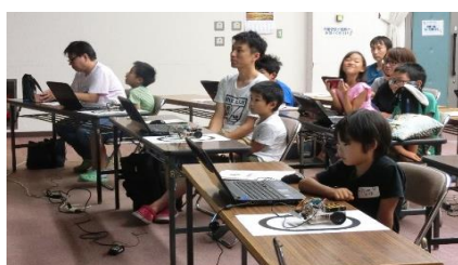
パソコンを使って、どんな風にロボットを操作させるのか、皆、真剣です!