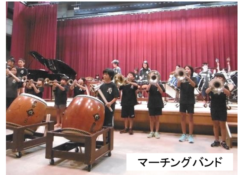
マーチングバンド