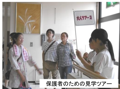
保護者のための見学ツアー