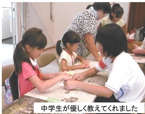
中学生が優しく教えてくれました