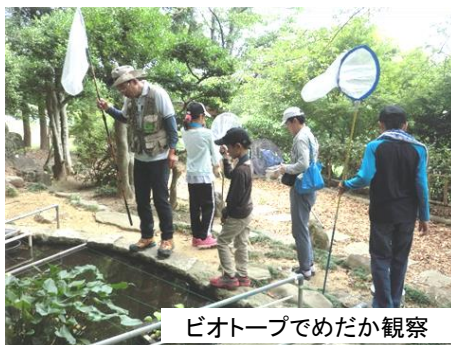
ビオトープでめだか観察

8月6日(土) 小学生親子 21 人が参加し、渡刈町「糟目春日神社」にて生き物調査をしました。最初に DVD を見て昆虫の特徴や見分け方、鳴き方などを学びました。その後、学んだ知識を生かして観察することができました。当日は猛暑日でしたが、木かげでは親子で仲良く蝉取りを楽しんでいる微笑ましい姿も見られました。