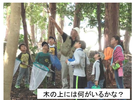
木の上には何がいるかな?