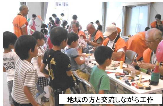
地域の方と交流しながら工作

今回、交流館の2階は小学生のみが入場できるエリアでした。子どもたちは、自分で選んだ体験に目を輝かせながら取り組み、充実した時間を過ごしました。