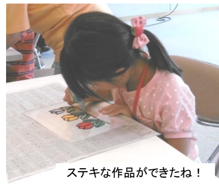
ステキな作品ができたね!

丸守木材(株)様から売上金 7,900 円の寄付をいただきました。熊本地震災害義援金として社会福祉協議会へ募金しました。ご協力ありがとうございました。