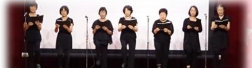
おはなしの会『ののはな』