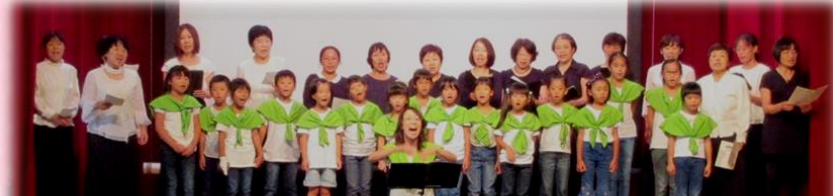
『コール結』&『きらきらハーモニー合唱団』&『ののはな』