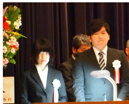
司会を務める昨年の新成人