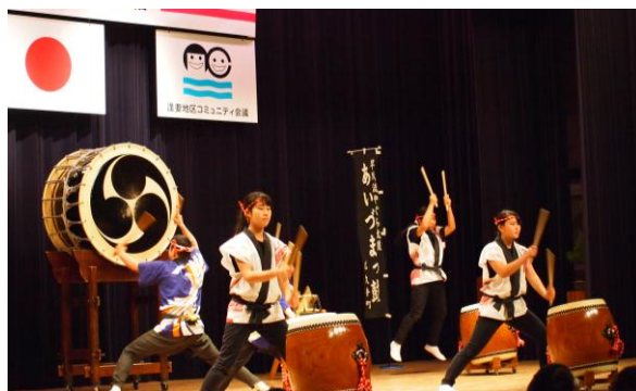
あいづまっ鼓祝い太鼓（広久手町）