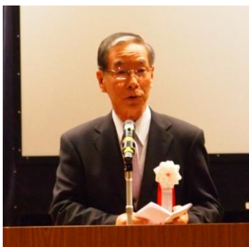
コミュニティ会議会長式辞