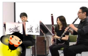
▼豊田木五團コンサート

梅雨の合間の晴天の中、「おぼら魅力発見★バスツアー〜」が行われ、21名の参加者で小原地区を巡りました。