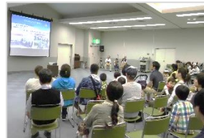
▲ホタル保護活動の発表

その後、交流館敷地内チャイルドパークへ移動し、幻想的なホタルの舞をみんなで鑑賞しました。