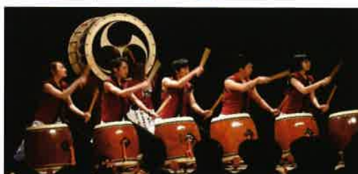
祝い太鼓（あいづまっ鼓、早川流やぐら太鼓）