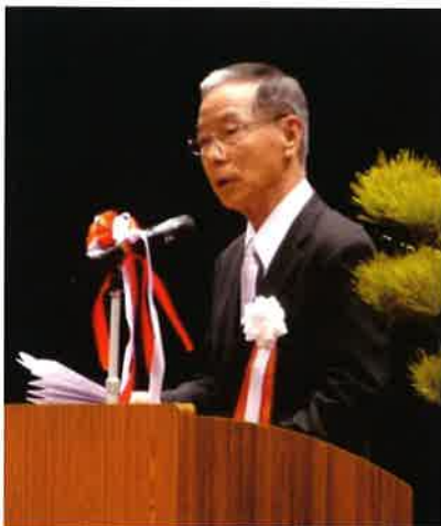
コミュニティ会議会長式辞