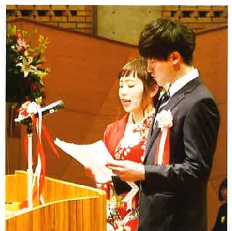
新成人 誓いの言葉