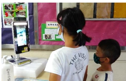
上手に測れると嬉しいよ!