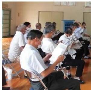
地域の区長さん方が見守る中、誓いの宣言